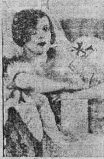
Alma Rubens, la bellísima estrella de la pantalla que acaba de fallecer en su residencia de California víctima de las drogas heroicas