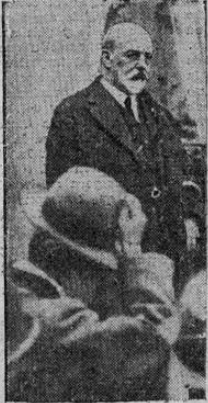
M. Théodore Steeg, radical-socialista, saliendo del Palacio del Eliseo recientemente, después de haber recibido del Presidente Doumergue el encargo de formar el nuevo ministerio, para suceder al de André Tardieu