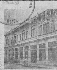
V. E. ALVAREZ & Co. Nuestro propio edificio, local de la ferreteria y almacenes

Pregúntele a las personas inteligentes por que nos conocen todo lo que necesitamos para su industria, casa o hacienda