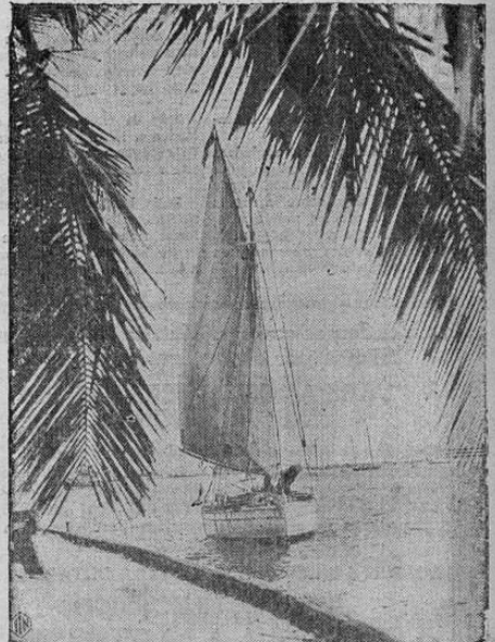
Bonita escena en la bahía de Miami, Florida, Estados Unidos, tomada a la llegada del buque de vela de 36 pies de largo, en que Ahto y Kou Walter, de Revel, Estonia, completaron su viaje de 7,000 millas a través del Atlántico. Salieron de su patria el 7 de agosto y llegaron a Miami el 18 de diciembre, después de haber luchado con numerosas tempestades en el océano