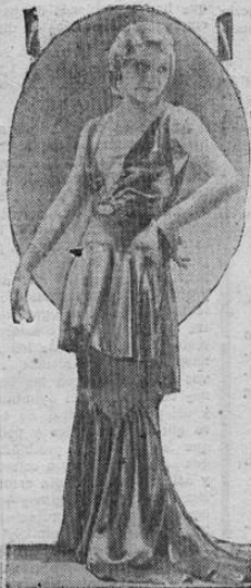
Hermoso traje de terciopelo rojo, de una admirable perfección de líneas. Se lleva con medias color carne y zapatillas rojas