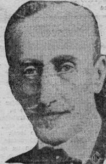
El vizconde Willington, ex-gobernador General del Canadá, ha sido nombrado Virrey de la India por el Rey Jorge V, para suceder a Lord Irwin