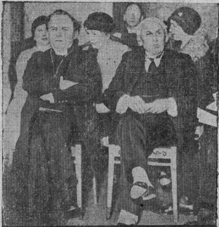
Dr. Nathan Soderblom, Arzobispo de Upsala (a la izquierda) y Frank B. Kellogg, ex-secretario de estado de los Estados Unidos retratados en Oslo, Noruega, el día en que recibieron el premio Nobel de la Paz correspondientes a 1930 y 1929, respectivamente